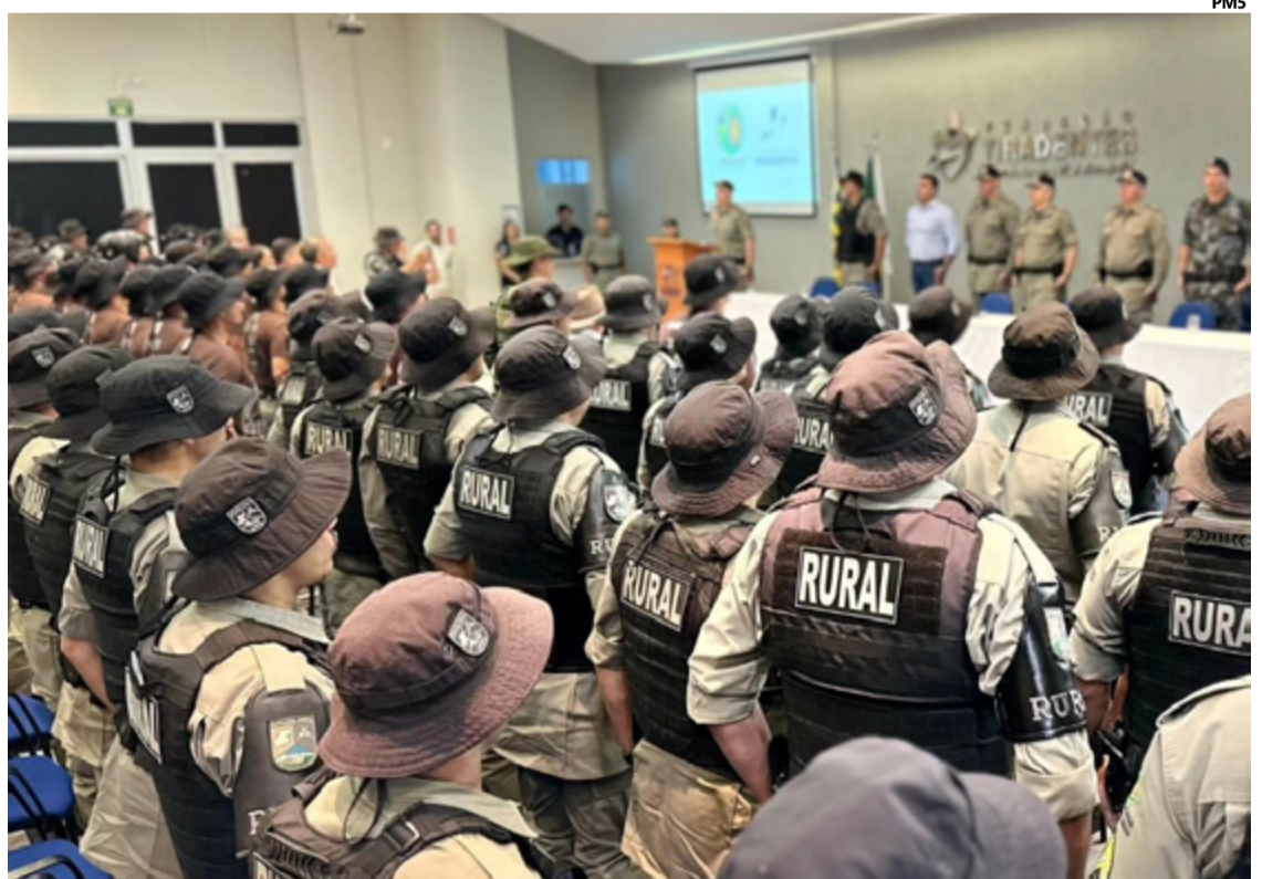
O curso terá duração seis semanas, sendo 300 horas/aula, e será ministrado na sede do batalhão rural