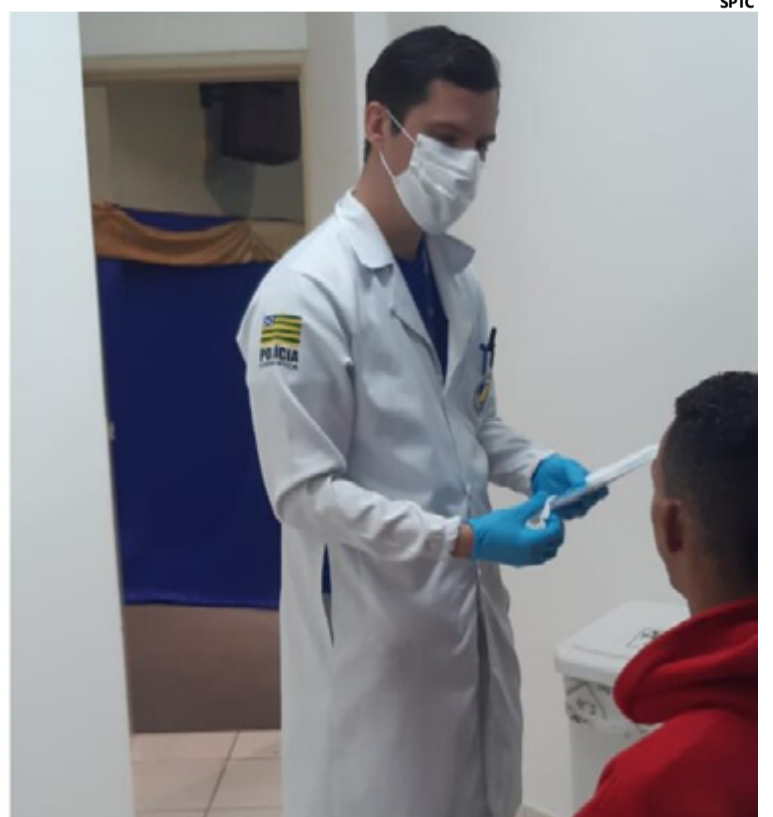
Em Goiás, a ação ocorrerá até o dia 30 de agosto, e 23 unidades da Polícia Científica estarão disponíveis como pontos de coleta

A campanha nacional está dividida em três etapas