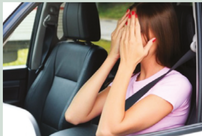
O estado de Goiás tem mais de 1,1 milhão de mulheres condutoras de carros, motos e ônibus nas cidades

No primeiro semestre deste ano, ocorreram 48.901 acidentes de trânsito em Goiás. Destes, 23% (11.392) envolviam mulheres, 60% (29.556) envolvendo homens e em 27% (13.569) dos casos não houve identificação do gênero. Dos