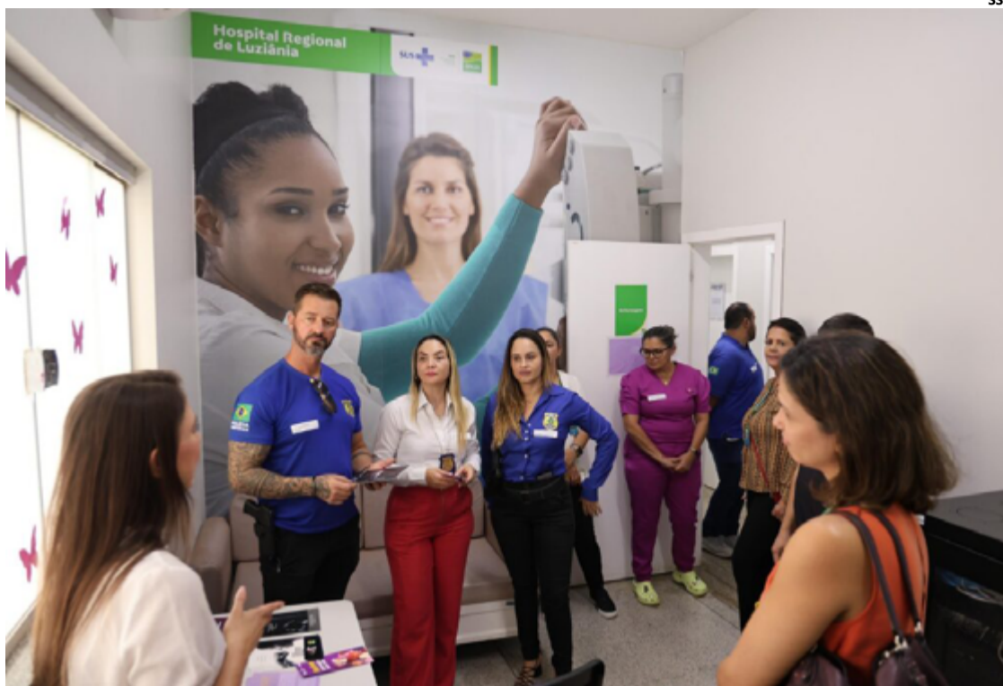
Equipes da SES e SSP visitam sala de atendimento às vítimas de violência no HEL