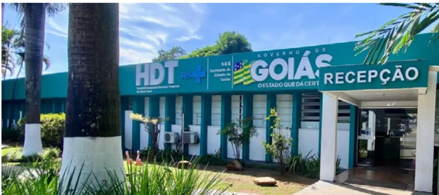
HDT é unidade de referência para tratamento de doenças respiratórias

Em casos mais graves, especialmente em indivíduos com fatores de risco, o VSR pode evoluir