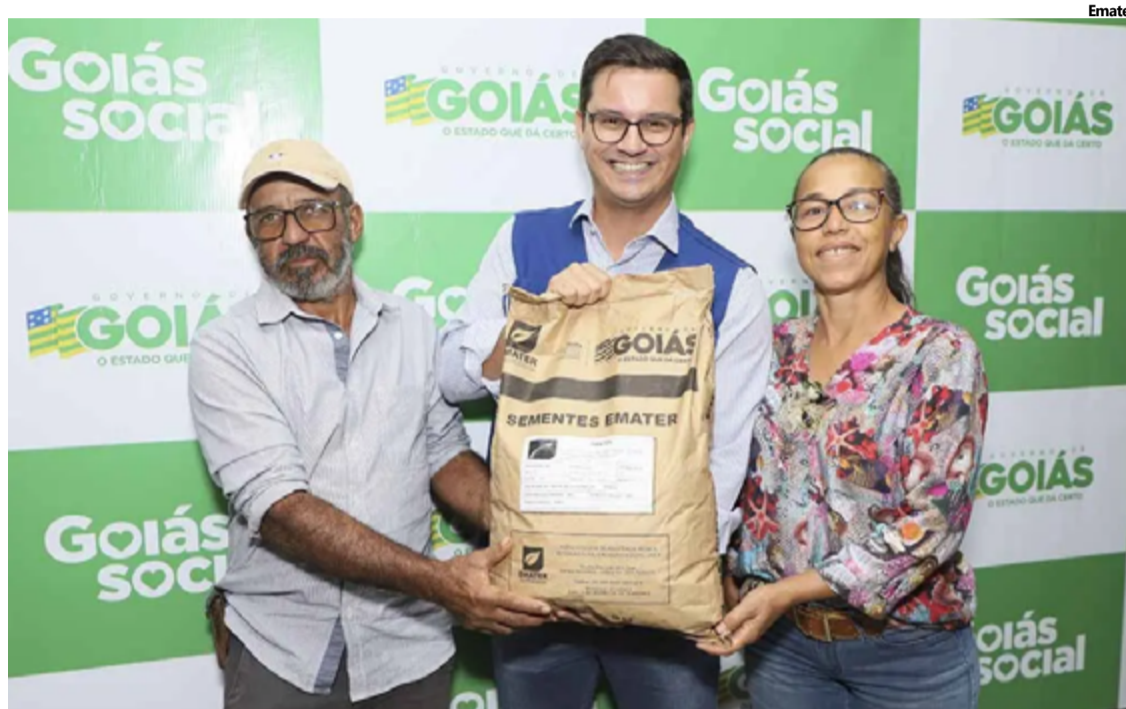
Expectativa é atender cerca de 4 mil produtores de leite em todo o estado

A expectativa é atender cerca de 4 mil produtores de leite em todo o estado. Cada produtor irá receber dois sacos de 10 kg para plantar um