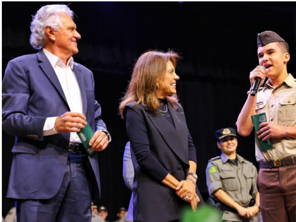
Governador Ronaldo Caiado e Gracinha entregam cartões do programa Bolsa Uniforme para alunos dos colégios militares

Ronaldo Caiado explica que o programa contribui para a economia das famílias. Até então, os pais custeavam o uniforme. “Não se pode de maneira nenhuma admitir que crianças e jovens sejam limitados por questões financeiras. Cabe ao Estado financiar e contribuir para a educação”, afirmou o go-