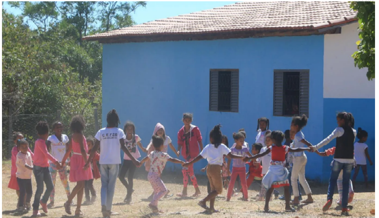
Essa mudança é essencial para o reconhecimento e a valorização da identidade de cada comunidade escolar

A Secretaria da Educação (SEDUC) justificou a medida na Exposição de Motivos, destacando que o projeto político-pedagógico das unidades de educação quilombola exige uma denominação que reflita o caráter específico dessas escolas. De acordo com a SEDUC, essa mudança é essencial para o reconhecimento e a valorização da identidade de cada comunidade escolar.