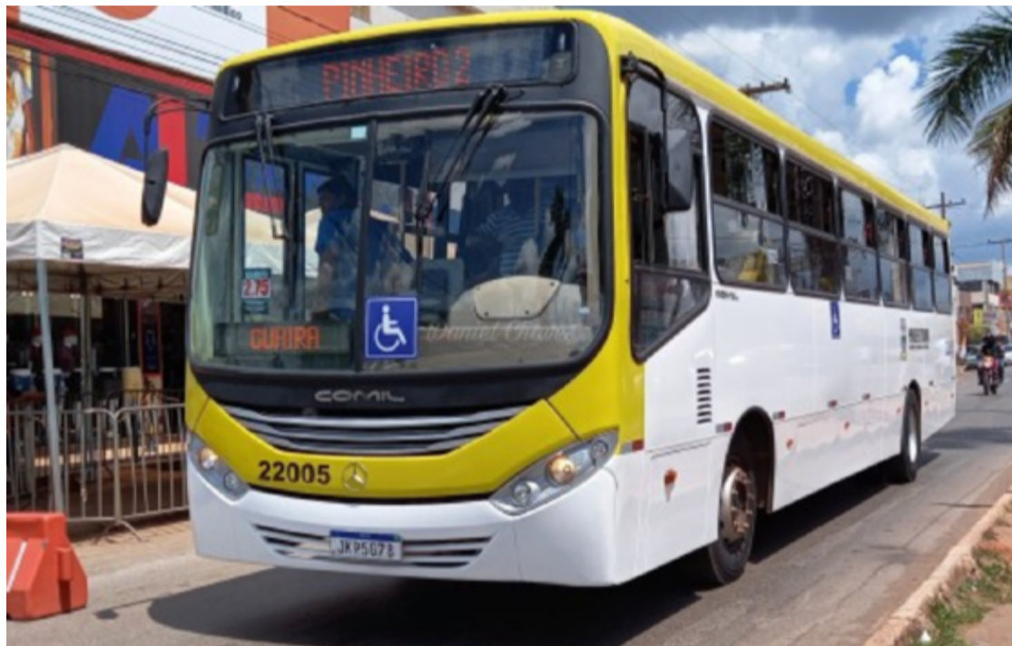
Diante dessas dificuldades, muitos moradores têm buscado alternativas, embora essas opções também apresentem desafios

Diante dessas dificuldades, muitos moradores têm buscado alternativas, embora essas opções também apresentem