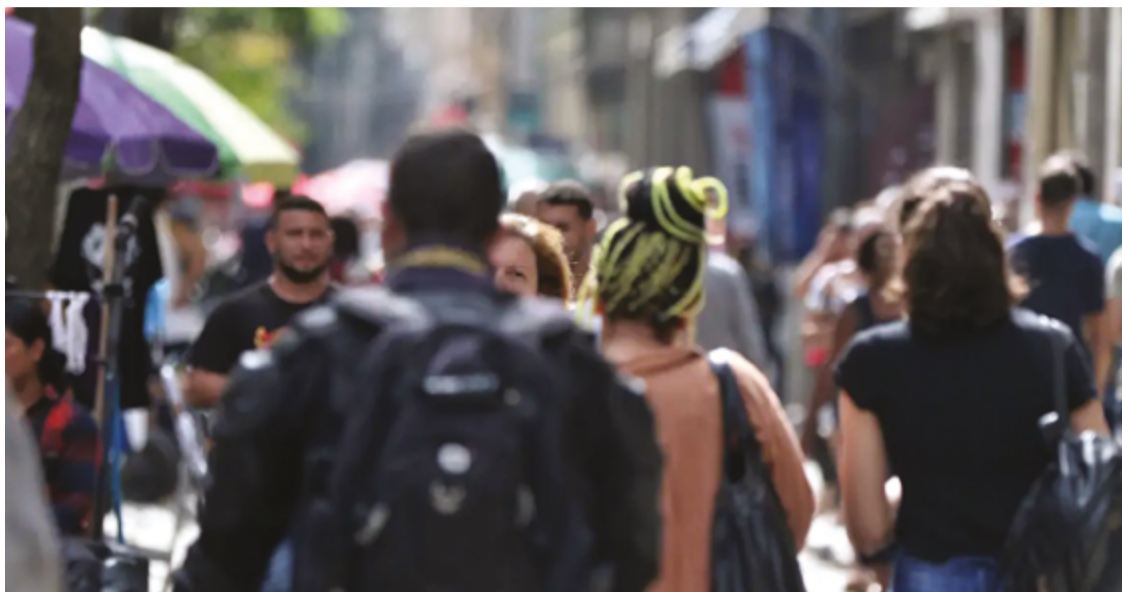
Projeção diz que Goiás, em 2047, antes de chegar ao ápice, terá número de óbitos maior que o de nascimentos

Já a nível nacional, o crescimento populacional será